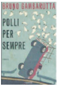
Bruno Gambarotta POLLICI PER SEMPRE Garzanti, 12.60 euro